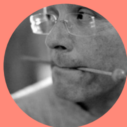
ALAIN LAFUENTE DÉCOR SONORE

Pascal Dubois (Éditions Oui Dire) a découvert la littérature orale par accident, en se perdant dans les méandres d'un conte. Sous le coup de l'émotion il cesse de produire des albums de musique et inconscient, se consacre à l'oralité des conteurs en fondant les éditions Oui'Dire en 2003.