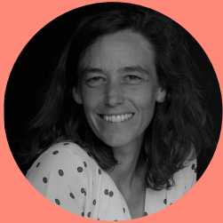
ANNE MINO PRODUCTION ET DIFFUSION

Artiste pluridisciplinaire, elle déploie son univers poétique dans des spectacles de rue ou de salle depuis plus de 30 ans.